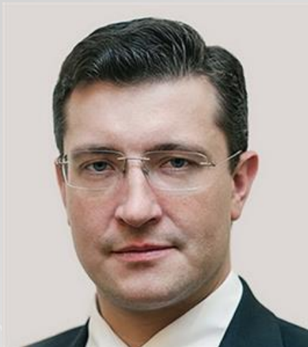
Первый заместитель Министра промышленности и торговли Российской Федерации Г.С. Никитин

«Данным постановлением предусмотрен механизм компенсации недополученных доходов АО «Росэксимбанк» по кредитам, выдаваемым в рамках поддержки производства высокотехнологичной продукции, путем предоставления субсидии из федерального бюджета.