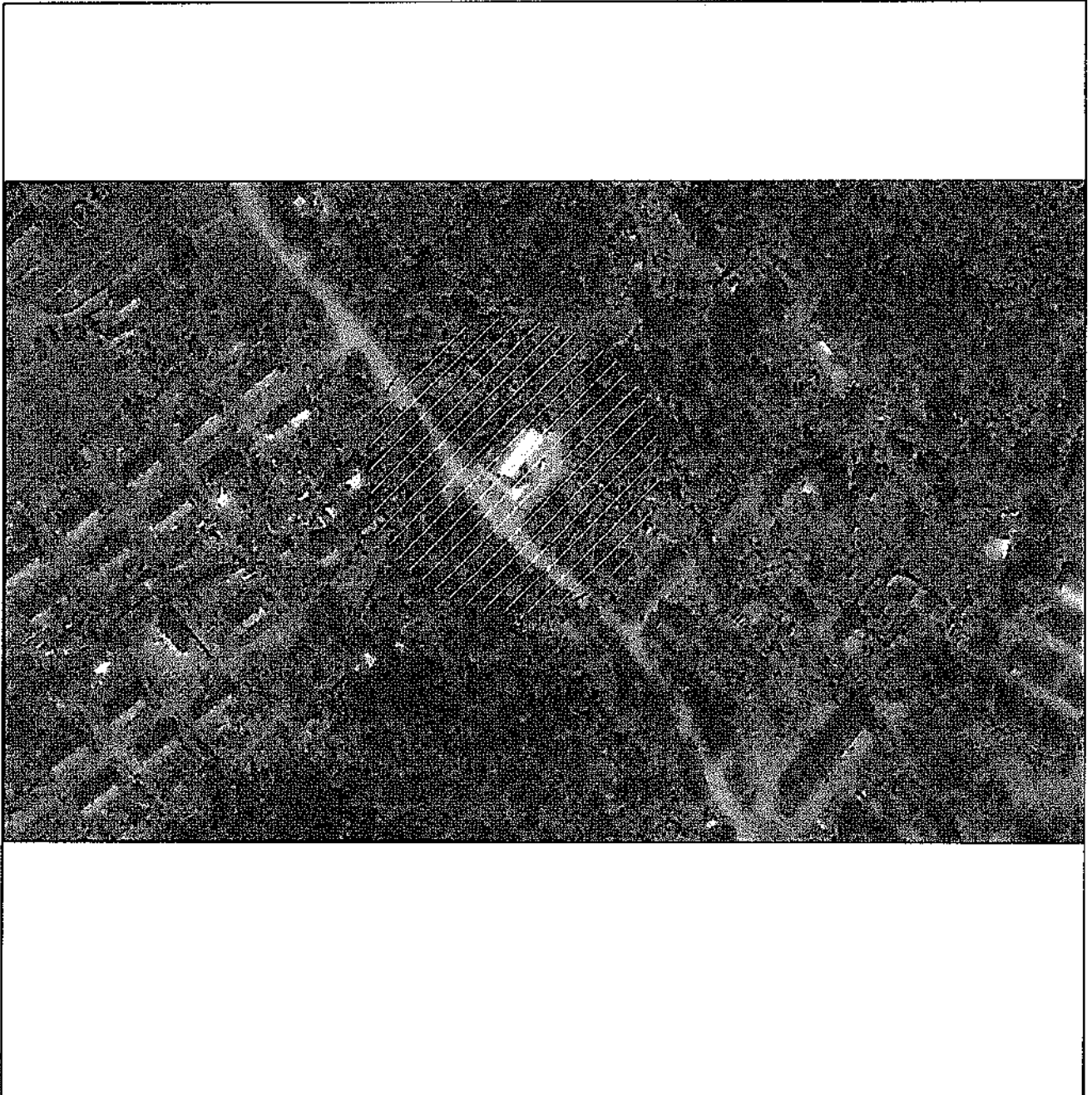
СХЕМА ГРАНИЦ прилегающей территории к зданию МКУ «Хийтольский культурно-библиотечный центр» в пос. Хийтола, на которой не допускается розничная продажа алкогольной продукции.

Территория, включая обособленную и дополнительную, на которой не допускается розничная продажа алкогольной продукции